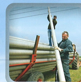
Manipulation d'objets encombrants