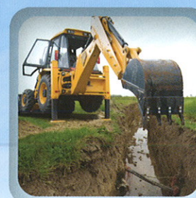
Aménagements de drains