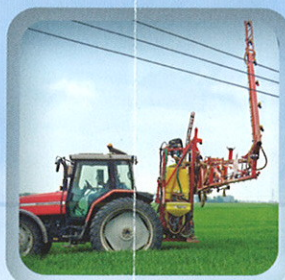
Manipulation d'engins de grande hauteur

Lorsque vous travaillez à proximité d'une ligne électrique aérienne, respectez une distance de 5 mètres (entre la ligne électrique et la personne ou l'engin ou l'outil ou une branche dans le cadre de l'élagage).