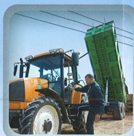
Déchargement ou stockage de produits